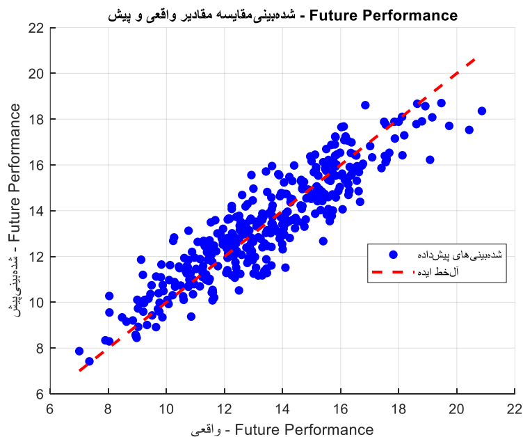
شکل ۱: عملکرد مدل رگرسیون برای پیش‌بینی عملکرد تحصیلی آینده

در مدل رگرسیون برای پیش‌بینی موفقیت در یادگیری شخصی سازی شده به‌عنوان متغیر وابسته مورد بررسی قرار گرفت. ضرایب مدل نشان می‌دهد که نمرات قبلی (۰/۴۷) و علاقه‌مندی‌های آموزشی (۰/۴۷) همچنان دو عامل کلیدی در موفقیت دانشجویان در یادگیری شخصی سازی شده هستند. علاوه بر این، تعداد تکالیف انجام شده (۰/۳۱) و میزان تعامل در کلاس (۰/۲۷)